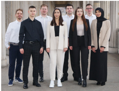
Das Projektteam des C4PO-Kongresses 2023 besteht aus Studierenden verschiedener Fachsemester des Studiengangs Facility Management der Hochschule für Technik und Wirtschaft Berlin, sowie der Berliner Hochschule für Technik.

und - Hand aufs Herz - wie weit sind Andere bei diesen Fragestellungen?